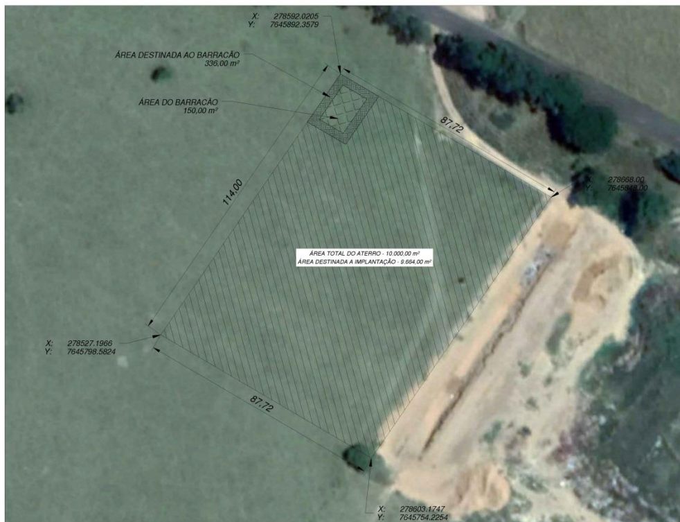
Imagem do local do novo aterro sanitário.

Com uma área de 10.000,00 m 2 ou 1,00 ha, caracterizará o mais novo local para disposição correta de resíduos, através de dispositivos que impeçam a percolagem de líquidos poluentes e degradação do meio ambiente no local.